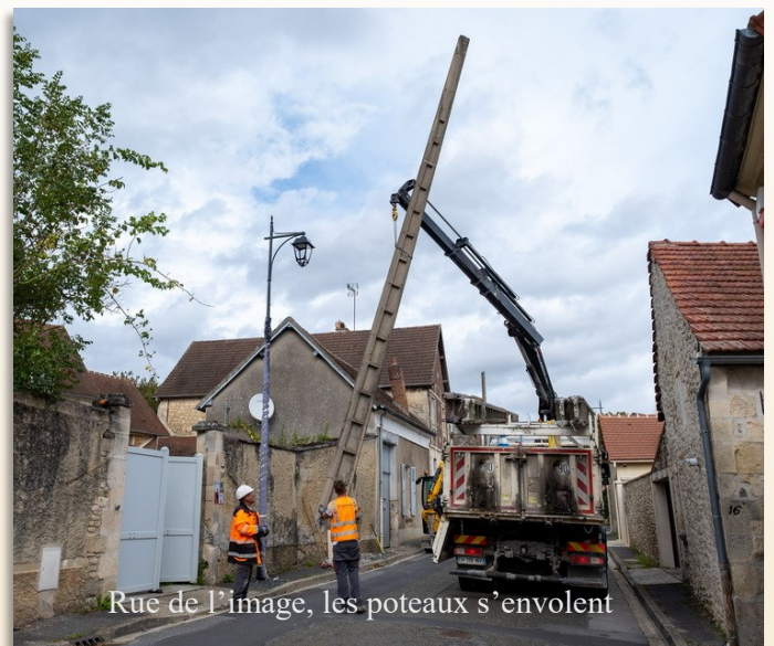
Rue de l'Image, les poteaux s'envolent

L'enfouissement des réseaux aériens est en cours rue de Pont Sainte Maxence, de la rue des Buissons jusqu'à la rue Verte, et rue des Buissons.