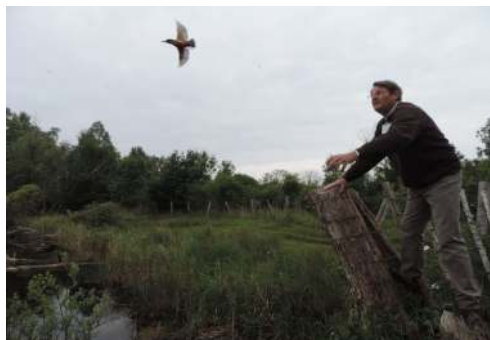
L'envol du Martin-pêcheur