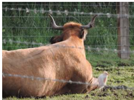
Le Héron garde boeuf

Merci à toute l'équipe de la Station pour la découverte de cet univers.