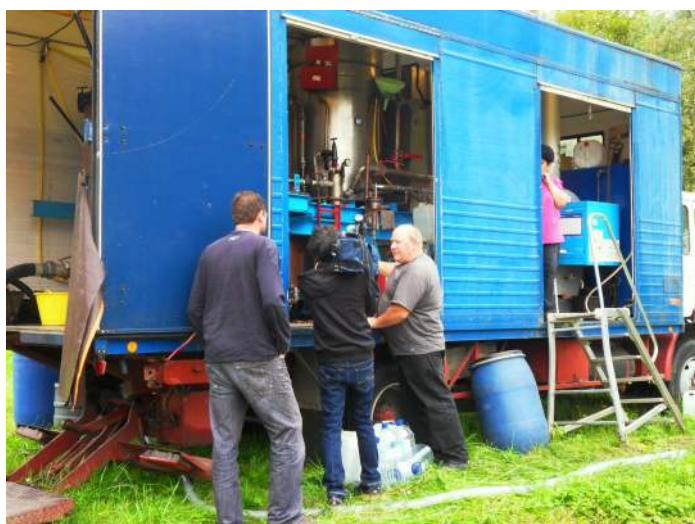
L'équipe de TF1 en tournage

A l'heure où paraît ce Cinquex Info, certains auront sans doute déjà vu ce reportage ; toutefois, si vous l'avez manqué, vous pouvez le revoir sur ce site : www.tf1.fr/jt-13h/ . Il reste en ligne environ 2 mois.