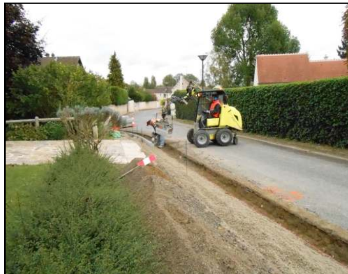
Les travaux dans la rue Petite Croix